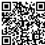
ユースミュージック練習